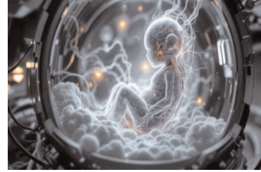
పిండాలును తియాన్-10 స్పేస్ స్టేషన్ కు విజయవంతంగా చేర్చింది.

ఇంటర్నేట్ డెస్క్, మే 26 మానవ భవిష్యత్తు, అంతరిక్ష పరిశోధనల చరిత్రలో చైనా ఒక కీలక ముందడుగు వేసింది. తొలిసారిగా మానవ కృత్రిమ పిండాలును అంతరిక్షంలోకి పంపి, వాటి అభివృద్ధిపై ఒక సంవత్సరం ప్రయోగానికి శ్రీకారం చుట్టింది. మే 10న లాంగ్ మార్చ్ 7 రాకెట్ ద్వారా ప్రయోగించిన తియాన్-10 మిషన్, ఈ కృత్రిమ