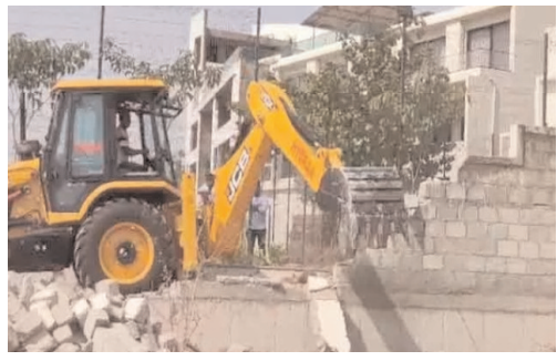
నిర్మించినట్లు గుర్తించిన ప్రముఖ "గోల్డ్ ఫిష్ విల్లాస్" కు చెందిన ప్రహారీ గోడను హైద్రా సిబ్బంది భారీ యంత్రాలతో కూల్చివేశారు.

హైదరాబాద్, మే 26 హైదరాబాద్ నార్సింగ్ పోలీస్ స్టేషన్ సర్కిల్ పరిధిలోని కోకాపేట్ కొత్తచెరువు పునరుద్ధరణ పనులు ప్రస్తుతం శరవేగంగా కొనసాగుతున్నాయి. ఇందులో భాగంగా చెరువుల పరిరక్షణే లక్ష్యంగా అక్రమ కట్టడాలపై విరుచుకుపడుతున్న హైద్రా అధికారులు మరోసారి గట్టి చర్యలు చేపట్టారు. కొత్తచెరువు పరిధిని (ఎఫ్ టిఎల్/ఓబిఆర్ జోన్) అక్రమించి