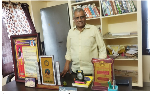
పౌరాణిక సంస్థల దిగజాల చేత కొన్ని వందల ప్రదర్శనలు ఇచ్చి మెప్పించారు. విద్యావేత్తగా, విద్యాసంస్థ అధినేతగా విద్యార్థులను ఉత్తమ పౌరులుగా తీర్చిదిద్దటంలో ఆయన తన వంతు పాత్ర పోషిస్తున్నారు. పదే తరగతి పూర్తిచేసిన విద్యార్థులకు ఉపాధి శిక్షణకు అవసరమైన కోర్సులు ఎంపిక చేసుకునేలా 'స్టామ్' ఐటిఐను ముడిచేప ల్లిలో ఏర్పాటు చేశారు. గత 30 సంవత్సరాలుగా అత్యుత్తమ విద్యాప్ర మాణాలను పాఠీస్తూ విద్యార్థులకు సాంకేతిక విద్యను అందిస్తున్నారు. కళా, సాంస్కృతిక, భాషా రంగాల్లో అపారమైన అనుభవం, ప్రజ్ఞ ఉన్న ఆయన నిరంతరం కొత్త విషయాలను తెలుసుకునేందుకు ప్రయత్నిస్తుంటారు. అధునాతన టెక్నాలజీని అందిచ్చుచుకుంటూ తమ కళాశాలలో చదివే విద్యార్థిని విద్యార్థులను ఉపాధి శిక్షణలో సరికొత్త ఒరవడి, నైపుణ్యాలను పెంపొందిస్తున్నారు.

డిమాండ్ ఏర్పడింది. సాంప్రదాయ పంటకాల్లో కొబ్బరిని ఎక్కువగా వాడుతున్నారు, దీంతోపాటు ఆదేశ సౌందర్య, ఇతరత్రా తయారీ సామాగ్రిలో కొబ్బరి వినియోగం బాగా పెరిగిందంటున్నారు. కువైట్, ఒమన్, దుబాయ్, ఇరాన్, సౌదీకి కొబ్బరి ఎగుమతులు జరుగుతుండగా ఆ దేశాలకు ఎగుమతులు చేసేందుకు అంతా సిద్ధం చేశారు. ప్రస్తుతం మిడిల్ ఈస్ట్ దేశాల్లో యుద్ధ వాతావరణంతో గుబులు వుట్టిస్తోంది. ఇరాన్ పై ఇజ్రాయెల్, అమెరికా సేనలు విరుచుకుపడుతున్నాయి. మరో పక్క దుబాయ్, కువైట్, సౌదీ ఆరేబియా, ఒమన్, బెహ్రయన్ దేశాలపై ఇరాన్ ద్రోష్లతో దాడులు చేస్తుంది. ఈ పరిస్థితిలో ముంబయి, చెన్నై, తూత్తుకూడి పోర్టుల్లోనే కొబ్బరి కారులతో కంటెయినర్లు నిలిచిపోయాయని అంటాజీపేట కొబ్బరి మార్కెట్ కు సంబంధించిన కొబ్బరి వ్యాపారులు, రైతులు చెబుతున్నారు. యుద్ధం ఎప్పుడు ముగుస్తుందో.. ఆయా దేశాలకు ఎగుమతులు ఎప్పుడు ప్రారంభమవుతాయో తెలియని అయోమయ పరిస్థితి నెలకొందంటున్నారు. ఆయా ఓడరేవుల్లో ఉన్న సరకును స్థానికంగా తక్కువ ధరకు అమ్ముకోవాల్సిన పరిస్థితులు ఏర్పడ్డాయని, ధరల పతనంతో తీవ్రంగా నష్టపోతున్నామంటున్నారు. గత నెలలో శివరాత్రి సందర్భంగా కోనసీమ కొబ్బరి మార్కెట్లో ధరలు అశాశనకంగా ఉన్నాయని, వెయ్యి పచ్చి కాయలు రూ. 18-20 వేలు పలికాయని రైతులు వెల్లడించారు. కుర్రీల ధరలు బాగానే ఉండగా శ్రీరామసంమికి దేశవ్యాప్తంగా మంచి ధర వస్తుందని వ్యాపారులు అశించారు. ఓడరేవుల ద్వారా గల్ఫ్ దేశాలకు వెళ్లి కొబ్బరికాయలు అక్కడే నిలిచిపోవడంతో ధరలపై ప్రభావం చూపిందంటున్నారు.