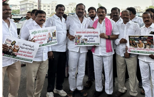
భారీ సంఖ్యలో పాల్గొన్నారు. నియోజకవర్గంలోని అన్ని విభాగాల నుంచి బీఆర్ఎస్ కార్యకర్తలు స్వచ్ఛందంగా తరలివచ్చి నిరసన తెలపడంతో ఎల్పీగర్ చౌరస్తా జనసంద్రంగా మారింది. ప్రజా సమస్యలపై రాజకీయ పోరాటం చేస్తామని నాయకులు స్పష్టం చేయడంతో నిరసన కార్యక్రమం విజయవంతంగా ముగిసింది.